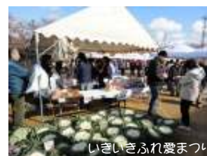
いきいきふれ愛まつり