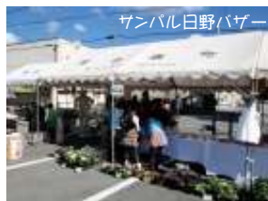
サンパル日野バザー