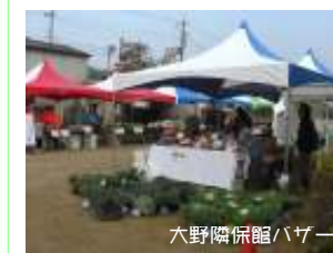
大野隣保館バザー