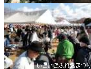
いきいきふれ愛まつり