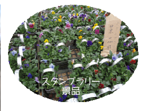
スタンプラリー景品