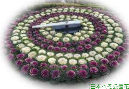
(日本へそ公園花時計)